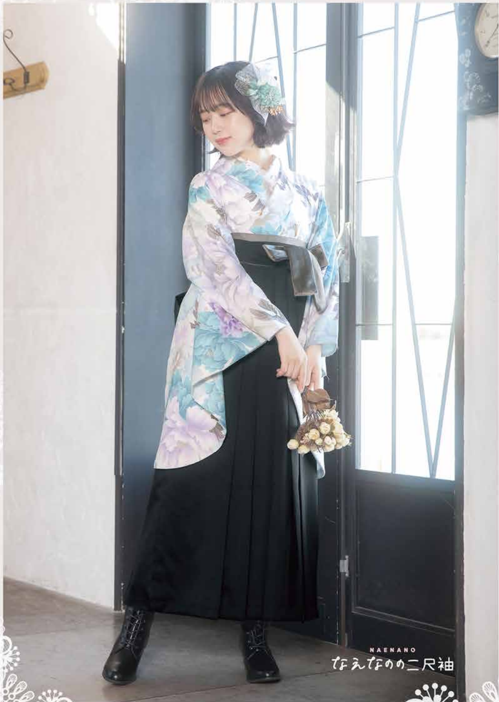
NAENANO たえたのの二尺袖