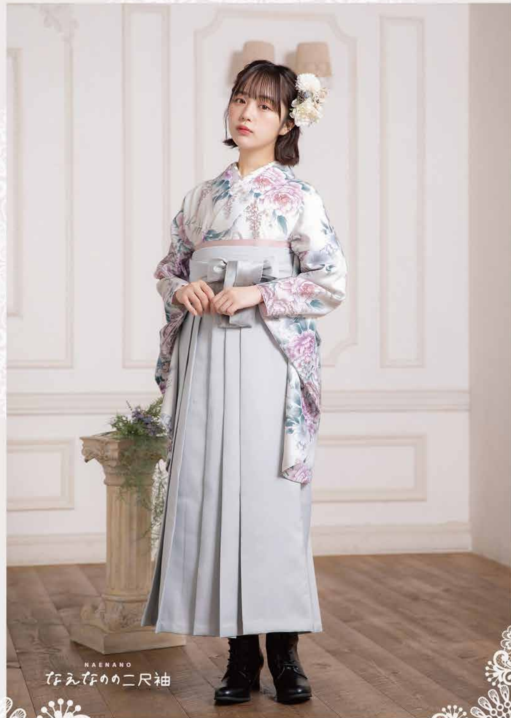
NAENANO たえたのの二尺袖